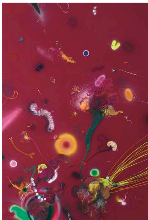
Abb 2. „ Closer than Paradise III (2005), 190 x 130 cm